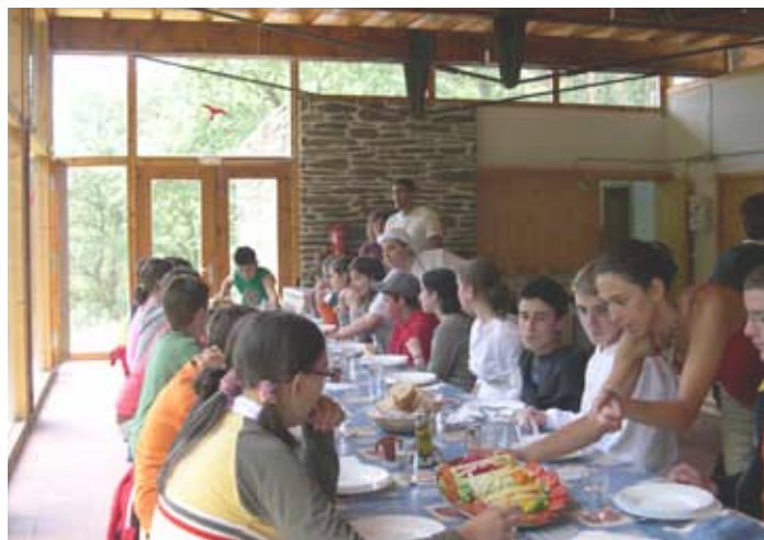
No centro ofrecemos produtos locais de tempada e de comercio xusto.

A aplicación consciente e difusión destes criterios convértese nunha medida real que favorece o desenvolvemento das pequenas fincas ecolóxicas, revalorizando os produtos locais e promovendo un mundo rural vivo.