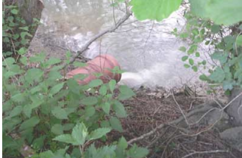
Os ríos galegos sofren continuamente novos vertidos.

As industrias son as causantes do maior ingreso de substancias altamente tóxicas nas augas, con concentracións de metais cuxa inxestión repetida en pequenas cantidades determina ao cabo do tempo, altas concentracións de metais nos tecidos do organismos. Estas augas contaminadas adoitan terminar no mar e gran cantidade de peixes para o consumo humano convértese pola súa parte en axentes tóxicos.