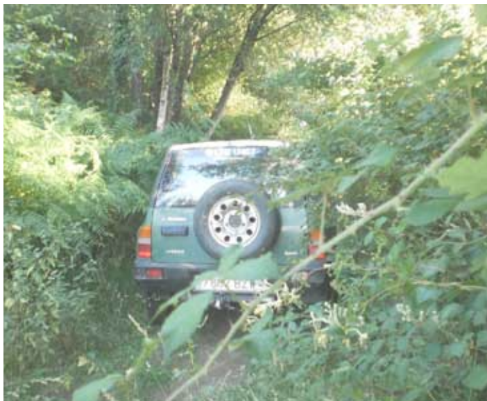
A falta de limpeza dos montes contribúen á propagación do lume.

Producido un incendio forestal, o clima, a meteoroloxía e o estado da vexetación son tres dos principais condicionantes, que non por elo causantes, da evolución e perigosidade do lume. Se este factores son adversos, pouco temos que facer diante de vagas de lumes como a acontecida no verán do 2006, pero se invertimos os nosos esforzos en mellorar a prevención, podemos evitar que moitos lumes teñan lugar.