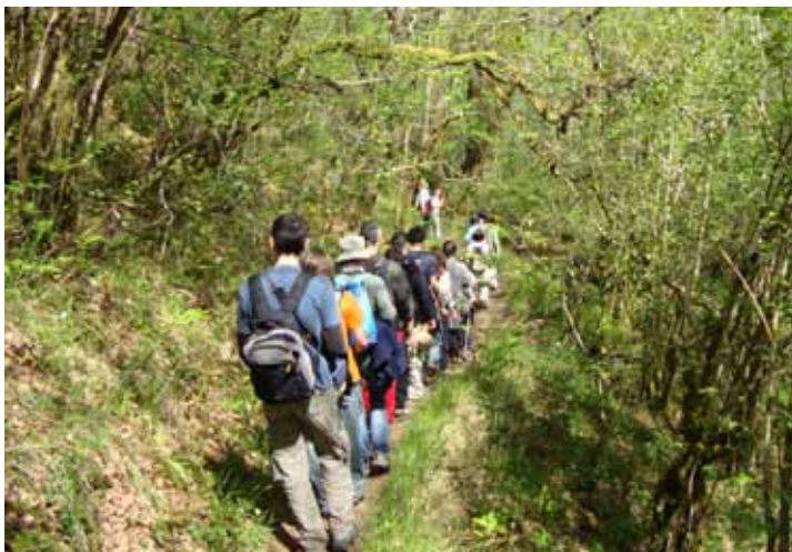
Realizamos rutas en zonas de interese ambiental de Galicia.

Dende Amigos da Terra animámosvos a participar nesta iniciativa, na que ademais de coñecer paraxes incomparables e disfrutar dun día en plena natureza, axudaredes a conservar o medio ambiente.