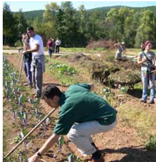
Dende a asociación defendemos a produción local e ecolóxica.

En As Corcerizas pretendemos dirixirnos cara un sistema alimentario diferente, no que todos e todas vivamos dignamente e teñamos suficientes alimentos sans e nutritivos, co horizonte de acadar conxuntamente a soberanía alimentaria dos pobos.