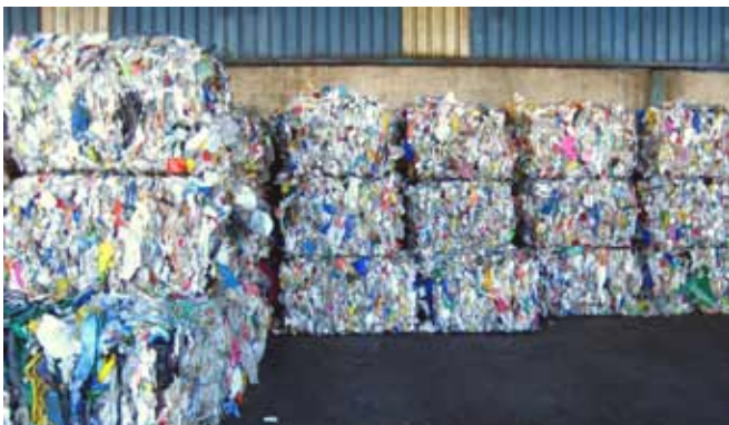
Toneladas de lixo amontóanse nas instalacións de SOGAMA, a maior parte rematará incinerándose.

Por iso, dende Amigos da Terra pedimos á Xunta de Galicia que de un xiro na súa política de residuos, baseada na súa maior parte na incineración, e siga o exemplo de Flandes, facendo unha aposta decidida pola redución na xeración de residuos (lonxe do 10% do novo plan), pola compostaxe e pola descentralización na xestión dos mesmos, como as medidas máis eficaces para reducir o gran volume de residuos de Galicia.