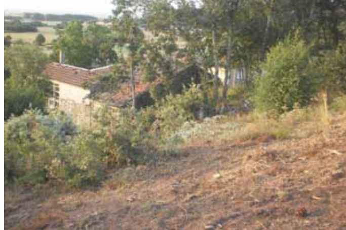
A limpeza das áreas próximas ás casas é fundamental.

En Galicia hai cun colectivo de 500 funcionarios públicos, axentes forestais, que deben e poderían cumprir con este papel, polos