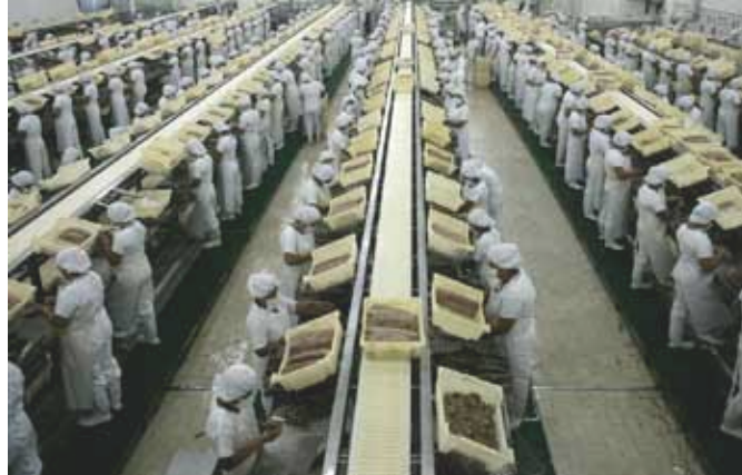
Traballadoras de Calvo na fábrica que a empresa galega teñe en O Salvador.

*Que as empresas multinacionais non se escuden nas lexislacións