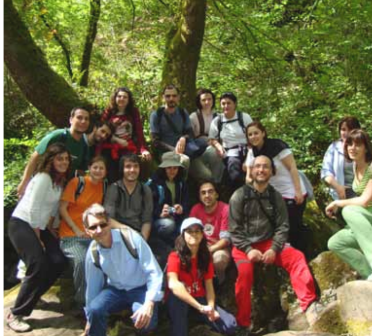
Un grupo de voluntarios/as durante a ecovixía ao Parque Natural de Fragas do Eume.