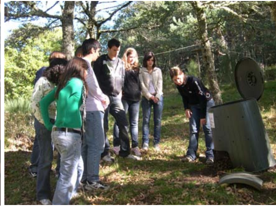
Facultade de Bioloxía. 17 Outubro 2008