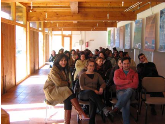
Obradoiro de emprego Marín. 14 Abril 2008

Un total de 115 persoas de entre 18 e 40 anos.