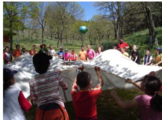
Campamento Concello Pontevedra. Xullo 2008

A aposta firme de Amigos da Terra por unha educación de alta calidade, a coherencia das instalacións e a profesionalidade da equipa, aportaron aos/ás nenos/as dos campamentos unha experiencia de alto valor, educándoos/as para vivir en coherencia e respecto nunha sociedade de futuro. Todas as actividades de achegamento á natureza desenvolvéronse cun dobre carácter: de serio compromiso ético e cunha metodoloxía lúdica e motivadora; proporcionando unha educación e información adecuadas ao grupo.