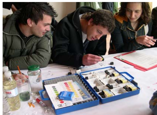
IES Palas de Rei. 15 Abril 2008

rapaces/zas procedentes de A Coruña, Lugo e Ourense, participaron neste novo programa.