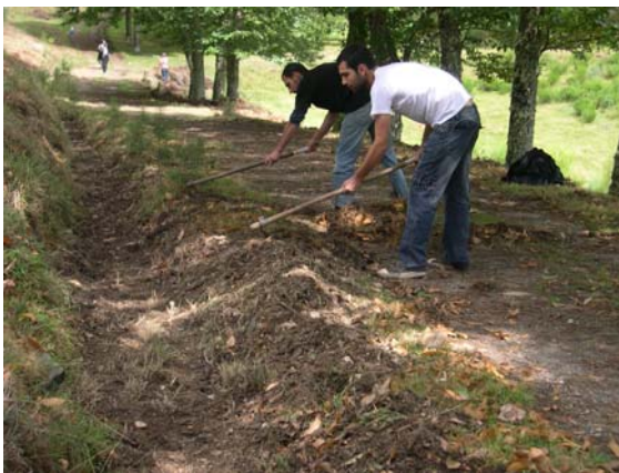
Xuntanza voluntariado 5-7 setembro

Do 5 ao 7 de setembro os/as voluntarios/as, e algúns deles socios/as, de Amigos da Terra pasaron unha fin de semana en As Corcerizas de convivencia e traballo común, grazas ao que se realizaron importantes melloras no equipamento: restauración de madeira con tratamentos ecolóxicos, limpeza de camiños, arranxos na cuberta vexetal dos tellados, melloras no mobiliario do albergue, mantemento dos paneis fotovoltaicos... Tamén puideron coñecer a zona a través dun roteiro pola montaña e disfrutar de xogos, veladas e obradoiros.