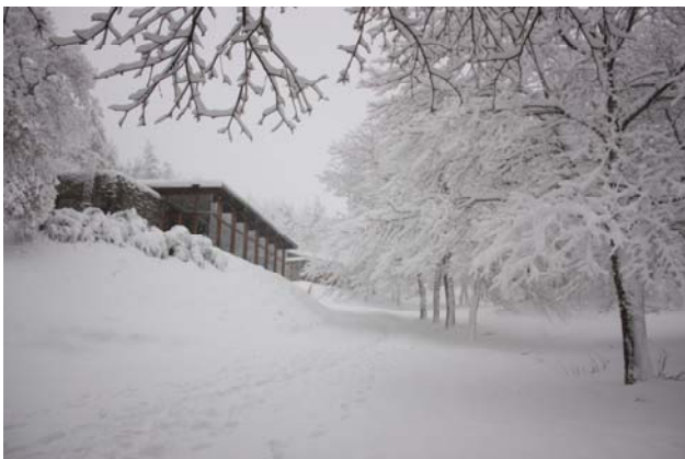
Curso Especialización Interpretación do Patrimonio. 28-30 Novembro 2008.

Despois do éxito do curso de iniciación impartido o pasado outono, abriuse a oportunidade de continuar coa especialización no coñecemento de técnicas e metodoloxías para planificar, deseñar, desenvolver e avaliar actividades guiadas ou de contacto co público. Para logralo aplicáronse de xeito práctico os contidos tratados durante a fin de semana.