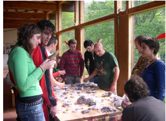
Naturalmente Galiza. 23-25 Maio 2008

Durante catro fins de semana, en abril e maio, participamos no programa que organiza a Dirección Xeral de Xuventude e Voluntariado, Naturalmente Galiza . A reestruturación e novas actividades incorporadas no programa resultaron todo un éxito. Un total de 88 persoas puideron disfrutar da montaña a través dunha ruta polo Bidueiral de Montederramo. Coa colaboración da S.G.H.N. tamén ao longo da ruta se fixeron actividades sobre rastros e sinais de fauna. As fins de semana completáronse cun baño termal no balneario de Baños de Molgas, e cunha ruta a cabalo polos arredores de As Corcerizas.