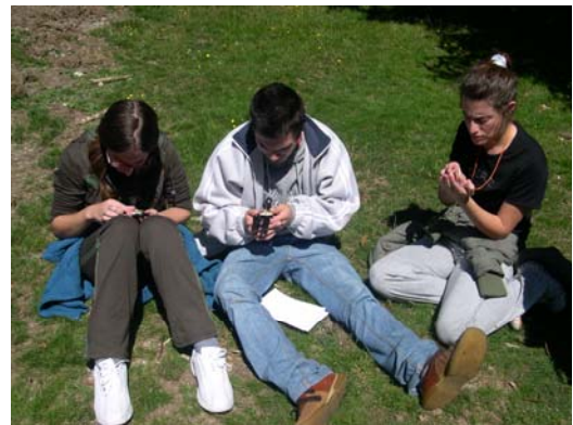
Orientación na montaña. 12-14 Setembro 2008

E tamén houbo tempo para coñecer o equipamento e o seu funcionamento, creando un gran interese e espazo de reflexión.