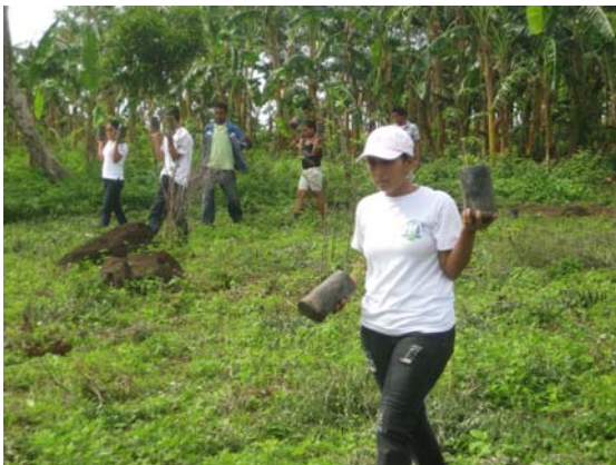
Golfo de Fonseca (CODDEFFAGOLF).

Ano 2010 - 2011: “Redución da vulnerabilidade alimentaria e uso racional dos recursos naturais na micro-cunca do río Laure, Honduras” (monto asignado 349.464 €) Subvencionado pola Dirección Xeral de Relacións Exteriores e coa Unión Europea: